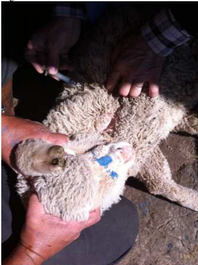
Fig. 6 – Ovino sendo tratado com injeção de ivermectina e imediatamente marcado com tinta para identificação.