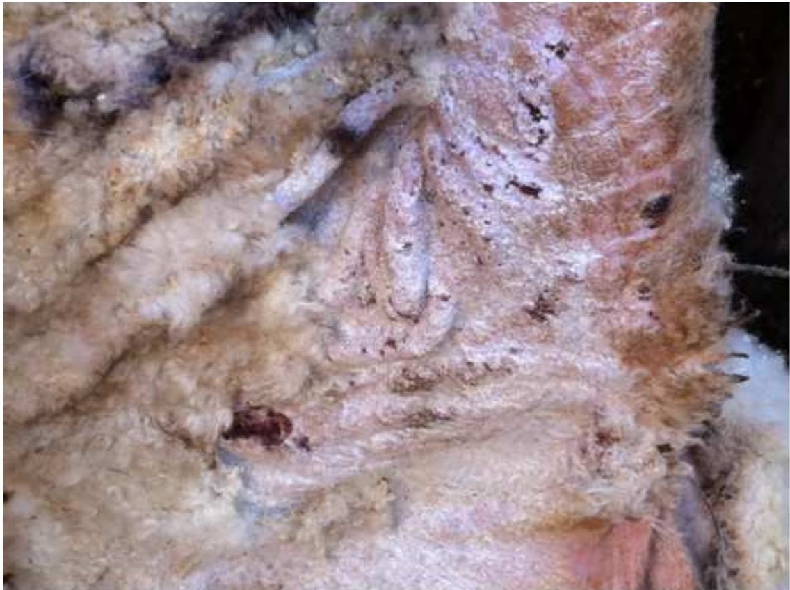
Fig. 5 – Lesão se sarna ovina.