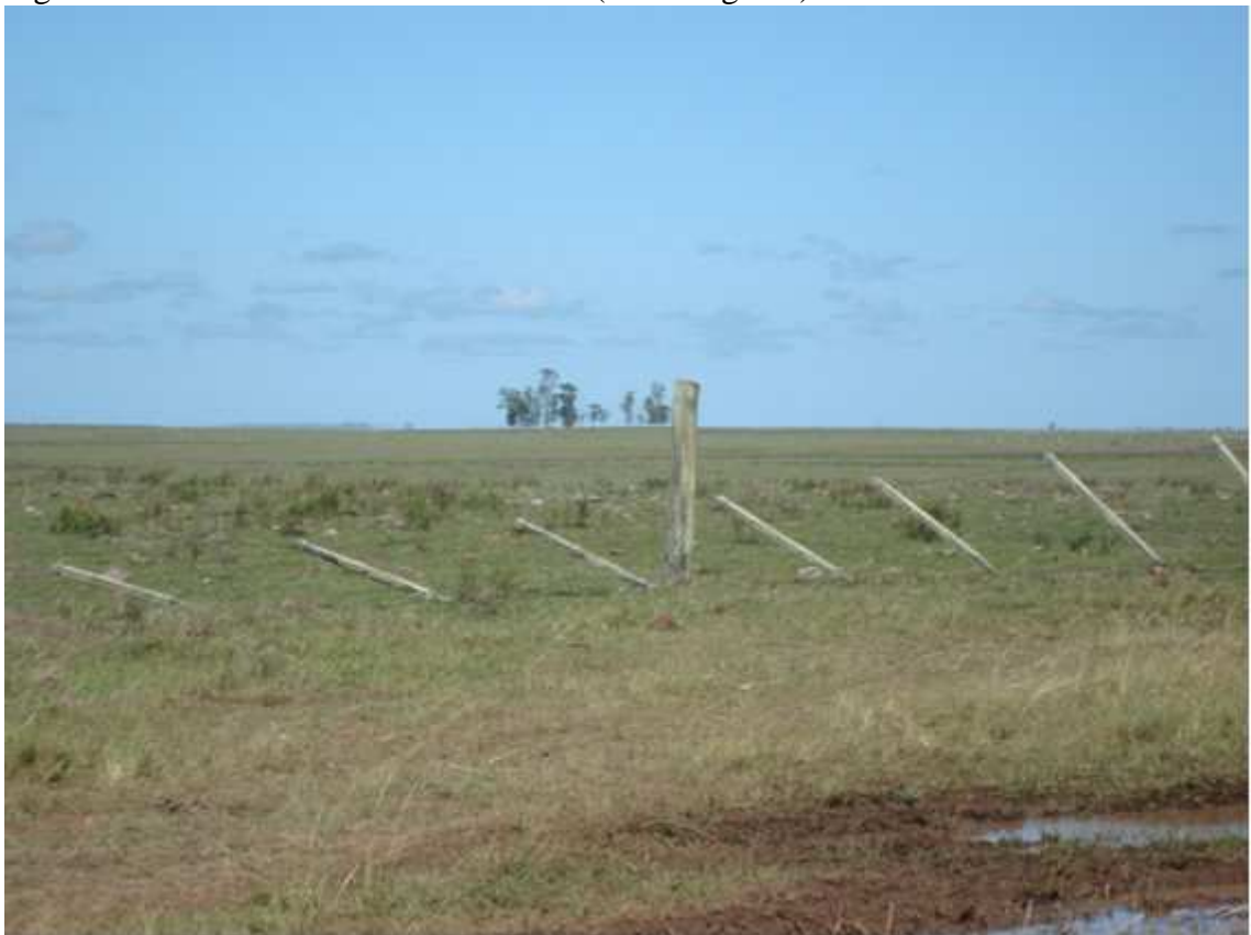
Fig. 2 - Cercas uruguaias abaixadas propositalmente para o gado ter acesso a melhores pastagens nos corredores entre os dois países. Desta maneira fica fácil para ovinos parasitados com sarna passarem para o lado brasileiro.