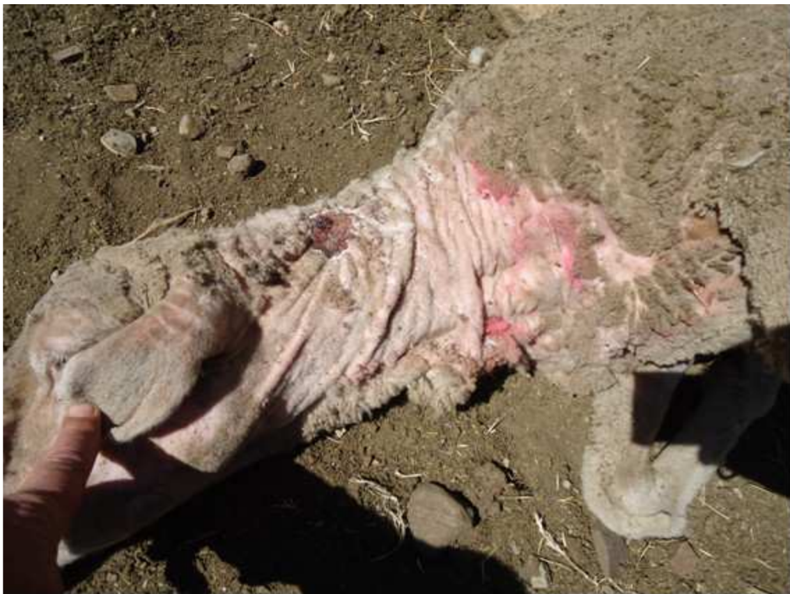
Fig. 4 – Lesões de sarna ovina.