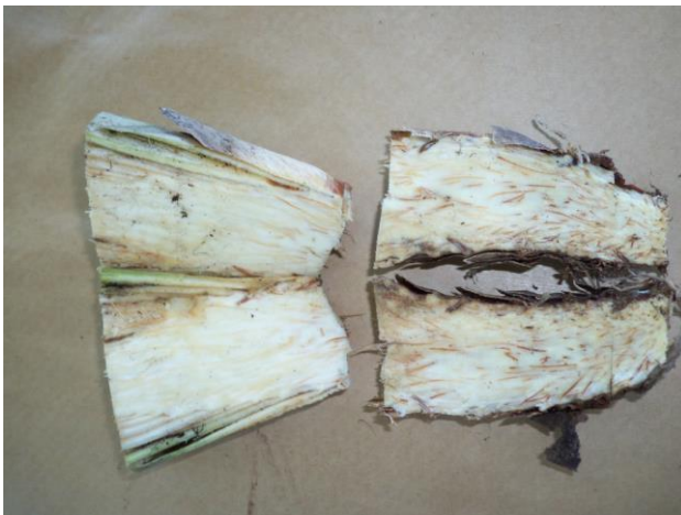
Figura 9. Talo de abacaxizeiro seccionado.