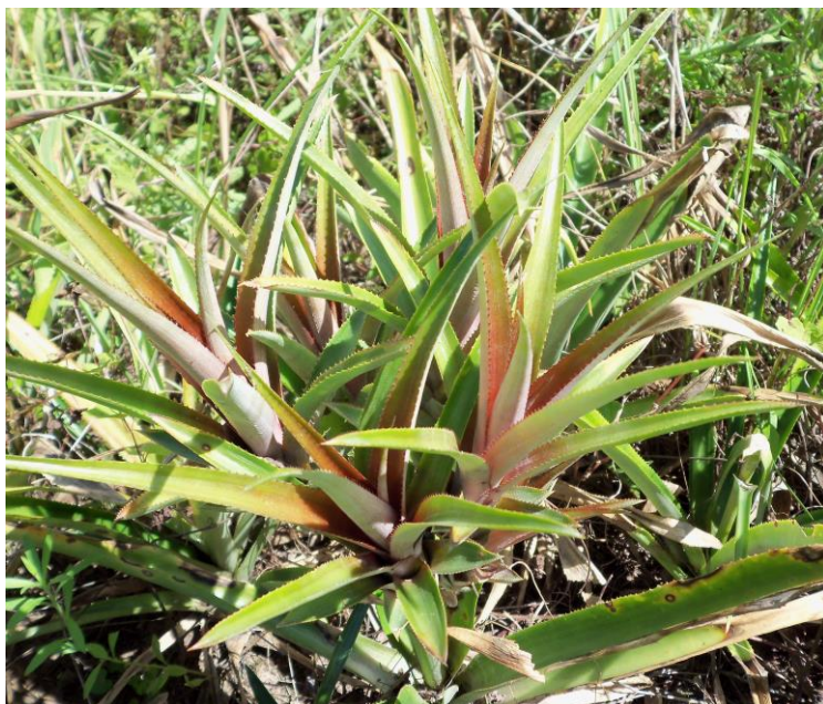
Figura 6. Manutenção das mudas de abacaxizeiro sobre a planta matriz para completar o desenvolvimento.

não pode plantá-las, faz-se a colheita e o armazenamento das mudas. Elas poderão ser conservadas por meses se forem mantidas verticalmente encostadas umas às outras, à sombra e em posição normal em períodos secos, porém ao ar livre e em posição invertida (bases para cima) em período chuvoso (PY, 1969).