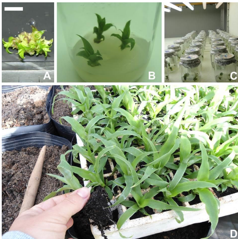
Figura 10. Micropropagação de abacaxizeiro Pérola de Terra de Areia. Múltiplas brotações de ápice foliar isolado em meio nutritivo (barra = 10 mm) (A); Multiplicação in vitro : cada explante origina múltiplas brotações (B); Cultivo em sala climatizada (C); Mudanças aclimatizadas em bandeja multicelular, sendo transplantadas para recipiente maior (D).