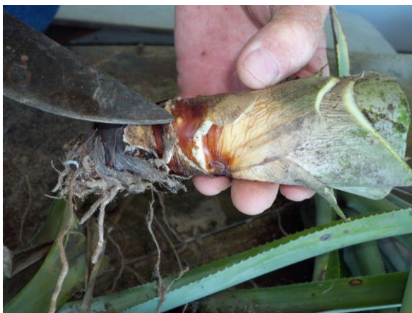
Figura 7. Gema de talo de abacaxizeiro.