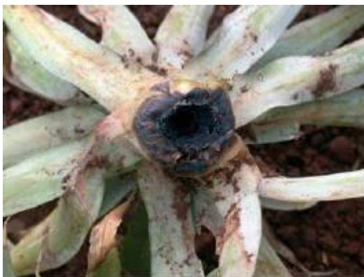
Figura 3. Podridão negra do abacaxi ( Thielaviopsis paradoxa ).

De acordo com Matos et al. (2018), além da fusariose e da podridão negra, o vírus PMWaV ( Pineapple Mealybug Wilt-associated Virus ) que causa murcha é transmitido pela cochonilha Dysmicoccus brevipes , o ácaro alaranjado ( Dolichotetranychus floridanus ), a broca do fruto ( Strymon megarus ) e a broca do talo ( Castnia invaria volitans ), também é facilmente disseminado pelas mudas de abacaxi (Figura 4).