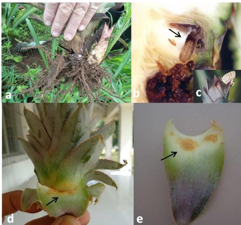
Figura 4. Pragas do abacaxi transmitidas por mudas. a) Cochonilha ( Dysmicoccus brevipes ); b) Broca do fruto ( Strymon megarus ) (c) Fase adulta da broca do fruto; (d, e) Acaro alaranjado.