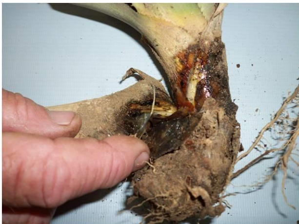
Figura 2. Sintomas de fusariose no talo do abacaxizeiro, causada pelo fungo Fusarium guttiforme Nirenberg and O'Donnell (Syn.: F. subglutinans f. sp. ananas )