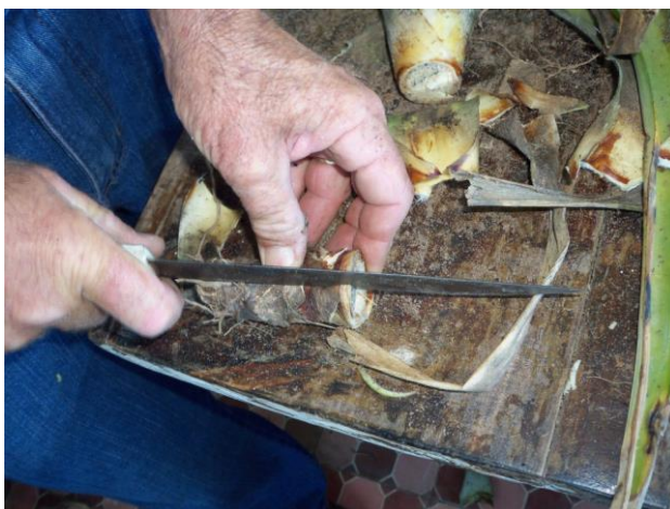
Figura 8. Divisão de talo de abacaxizeiro com facão.