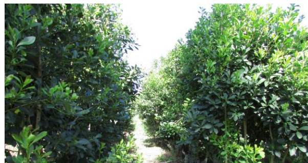
Nova Lei busca fomentar o desenvolvimento da cadeia produtiva da erva-mate no Brasil.