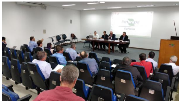
Reunião realizou-se no auditório central do centro de pesquisas Embrapa-Florestas, Colombo – PR.

- Formação de grupo de trabalho para posicionamento quanto à proposição de lei do preço mínimo da erva-mate.