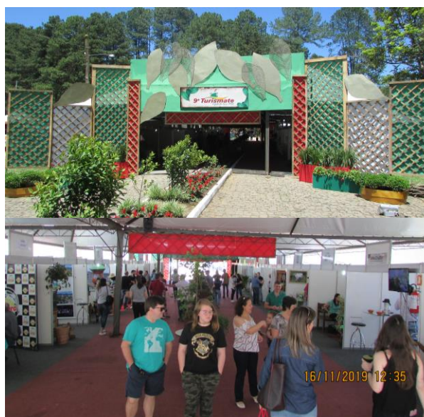
9ª Turismate realizou-se nos dias 15 a 17 de novembro de 2019.

especificamente, no Salão da Erva-mate, espaço em que estiveram presentes as instituições públicas locais, o IBRAMATE e ervateiras da região.