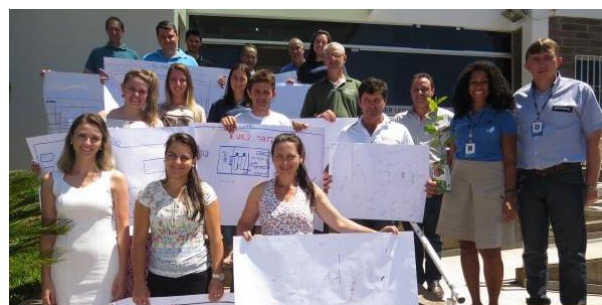
Figura 02: Participantes do curso de boas práticas de fabricação.

Em continuidade com os treinamentos de capacitação à indústria ervateira, a EMATER programa estender a oferta do curso para os outros polos ervateiros do Estado no decorrer de 2017.