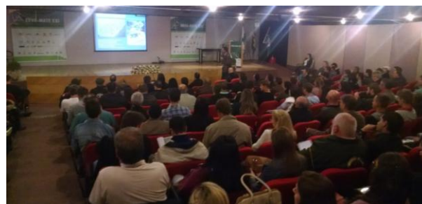
Wndling apresentou as pesquisas da Embrapa para a erva-mate junto do público.

vegetativa, o qual proporcionou o avanço da viabilidade de aplicação das técnicas de clonagem aos materiais genéticos selecionados da erva-mate, como a miniestaquia e a enxertia para substituição de copa.