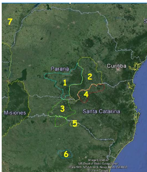
Figura 01: Distribuição da nova rede experimental para o programa de melhoramento genético da erva-mate na Embrapa Florestas.