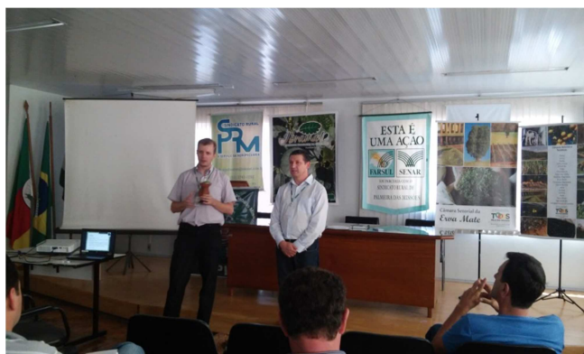
Abertura da 1ª reunião do ano em palmeira das Missões.

Nº 12/2016 - Porto Alegre, 15 de março de 2016