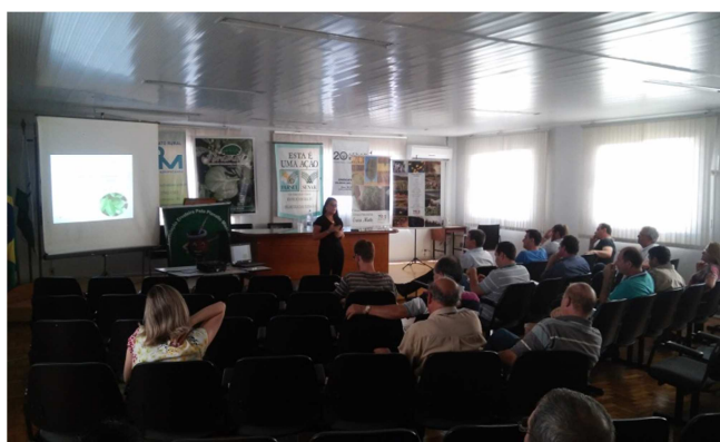
Apresentação do projeto de mestrado do Programa de pós Graduação em Agronegócio da UFRGS.