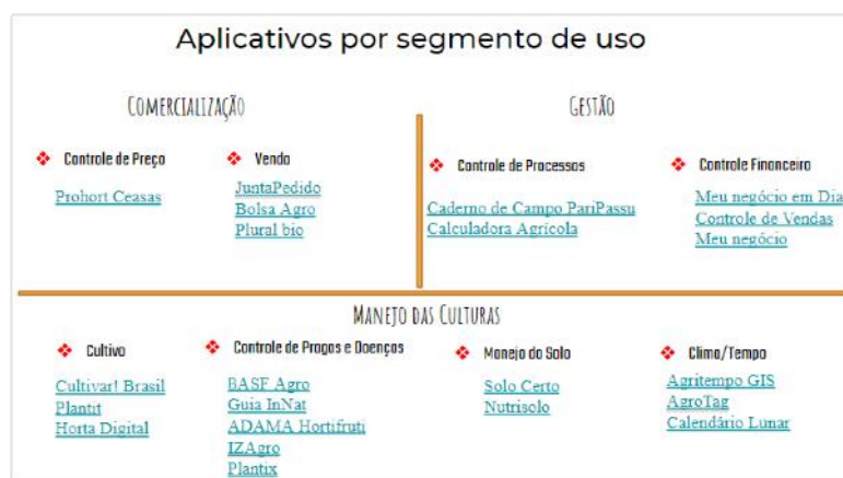
Figura 1. Aplicativos por segmento de uso.

O levantamento apurado pode ser visualizado na Figura 1.