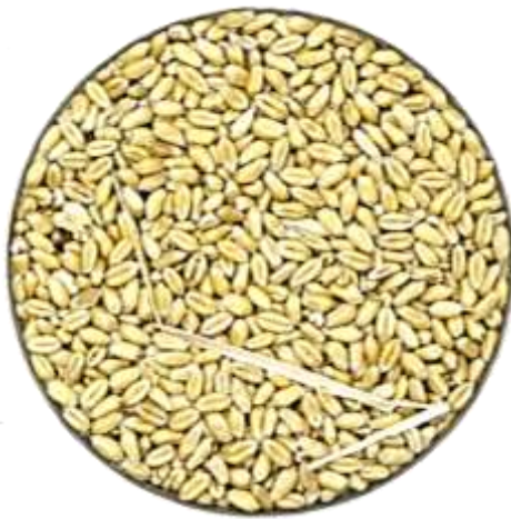
Figura 4: Fotos de grãos de trigo após processo de limpeza.

Somente com a integração de todas as ferramentas, chegaremos no resultado desejado. Todos devem colaborar.