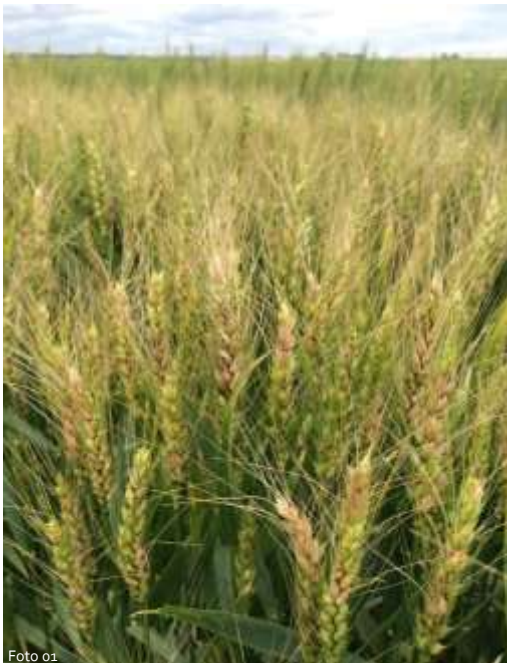
Figura 1: Fotos de espigas de trigo infectadas por giberela.

A DON é conhecida como Vomitoxina, causadora de problemas de saúde em animais e humanos devido a sua ingestão na dieta. Por se tratar de uma questão de saúde humana e animal, o consumo de trigo e seus subprodutos, como farinhas, massas e outros com presença de DON, tem sido tema de debate nos principais países produtores e consumidores de trigo em todo o mundo. O tema dessas discussões é a definição de limites máximos toleráveis (LMT) de consumo de DON e medidas de manejo para redução em pré e pós-colheita.