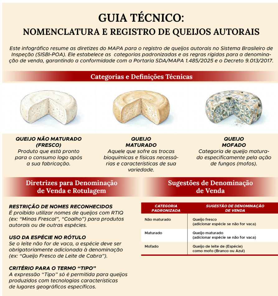
Figura 2. Guia técnico da nomenclatura de queijos autorais e diretrizes para denominação de venda dos produtos.

A Figura 2 apresenta de forma ilustrada um guia técnico da nomenclatura de queijos autorais e diretrizes para denominação de venda dos produtos.